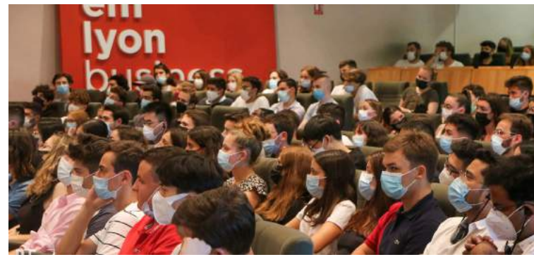
La conférence de Pascal Canfin , Président de la Commission de l'environnement du Parlement Européen, a inauguré le cours "Agir pour le Climat".

L'ODD N°10 " Combattre les inégalités " constitue le fil conducteur de l'année académique 2021-2022.